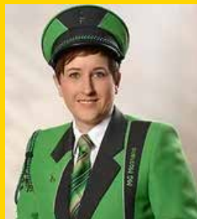
Brändle Marlies Musikgesellschaft Mosnang Kreis Toggenburg