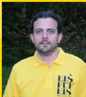
David Egger Werbung