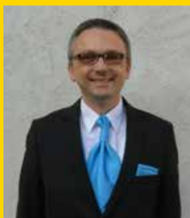
Jud Michael Musikgesellschaft Mühlrüti Kreis Toggenburg