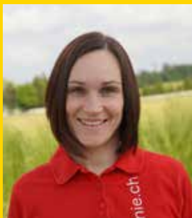
Frei Bettina Blechharmonie Kirchberg Kreis Toggenburg