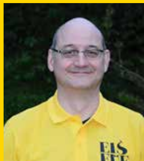
Christian Wiesli Musikalisches