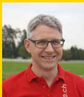
Pletka Urs Blechharmonie Kirchberg Kreis Toggenburg